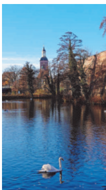
View on old town of Berlin-Spandau

Information über die finanzielle Unterstützung der Fortbildungsveranstaltung gemäß der Vorgaben des Kodex für die Zusammenarbeit der pharmazeutischen Industrie mit Ärzten, Apothekern und anderen Angehörigen medizinischer Fachkreise (FSA e.V.) und gemäß Eucomed-Code der European medical technology association: www.deutsch-polnische-gefaesschirurgen.de